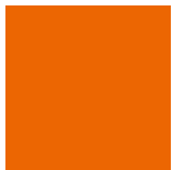
Orange C 0 / M 70 / Y 100 / K 0