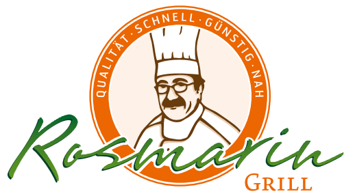
1. Standard- Logo