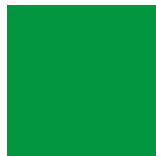
Grün C 100 / M 0 / Y 100 / K 0